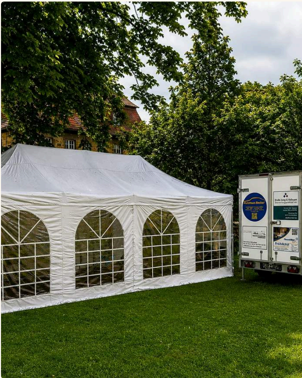
BEISPIELHAFT DRAMATURGIE — FREI ANPASSBAR