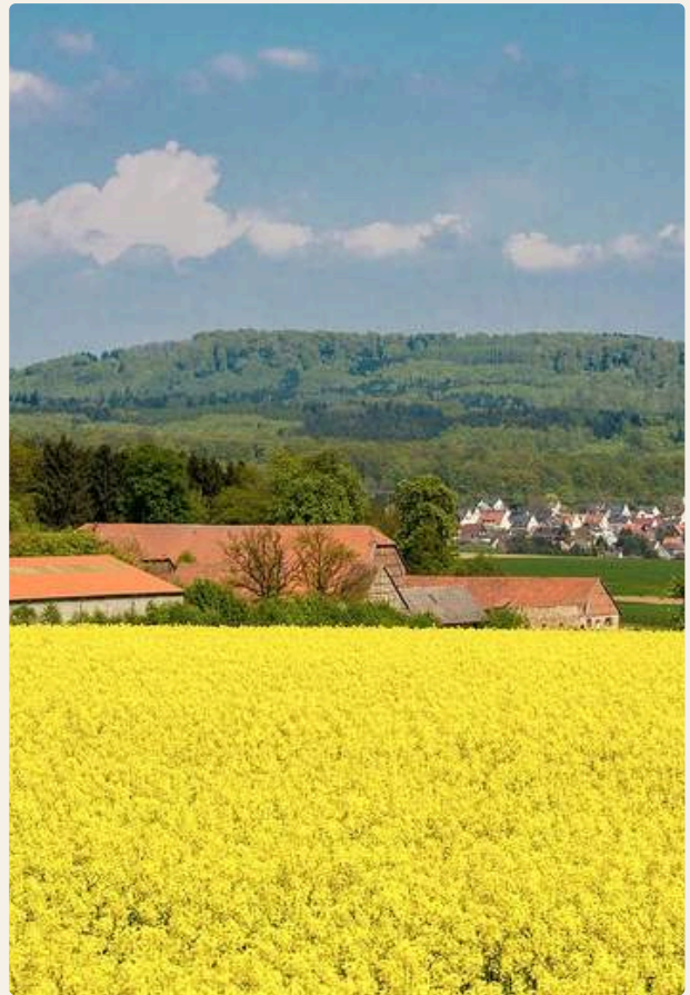
GUT WAITZRODT — NORDHESSEN, NAHE KASSEL

Und weil wir nicht aus der Eventbranche, sondern vom Hof kommen, erleben Ihre Gäste eine Gastfreundschaft, die sich nicht inszenieren lässt. Persönlich geführt, verlässlich, mit feinem Gespür für das Wesentliche.